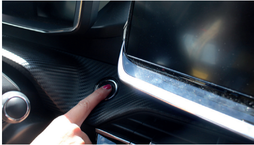
1. Fahrzeug stoppen