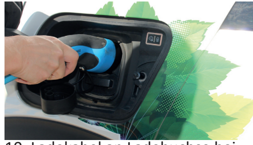
10. Ladekabel an Ladebuchse bei Auto anstecken