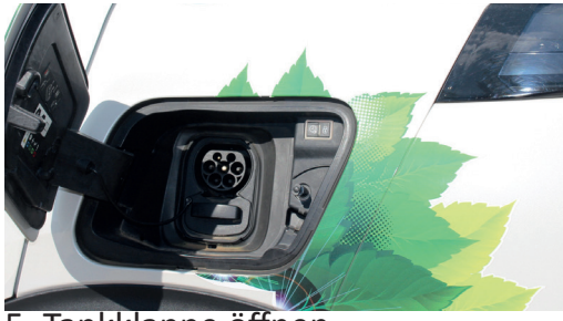
5. Tankklappe öffnen