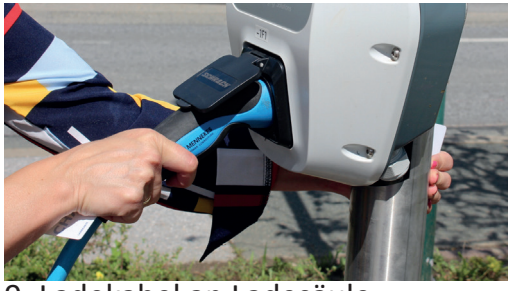
9. Ladekabel an Ladesäule anstecken