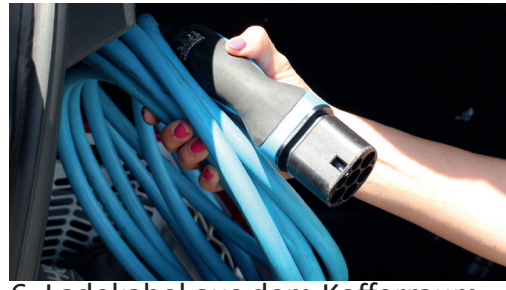
6. Ladekabel aus dem Kofferraum nehmen