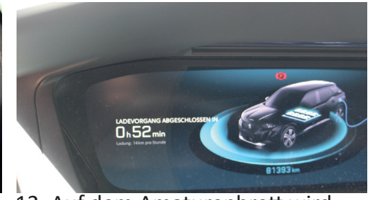
12. Auf dem Amateurbrett wird angezeigt, wenn das Auto lädt.