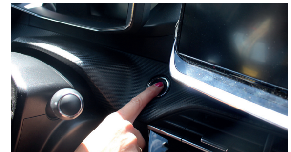
9. Fahrzeug starten