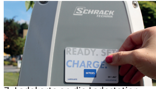
7. Ladekarte an die Ladestation halten - „Klick“ abwarten