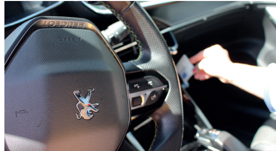
2. Ladekarte aus Kartenhalterung entnehmen