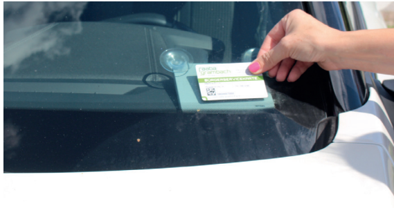
1. Fahrzeug aufsperrern