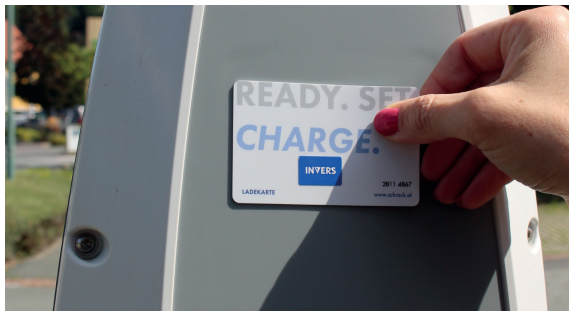
4. Ladekarte auf weißen Kreis der Ladestation halten und „Klick“ abwarten