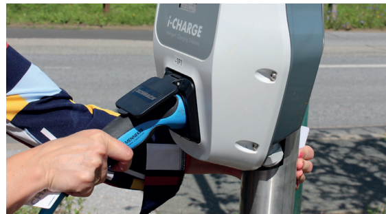
5. Ladekabel aus Ladestation entfernen