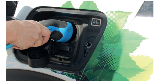
6. Ladekabel aus Ladebuchse beim Auto entfernen