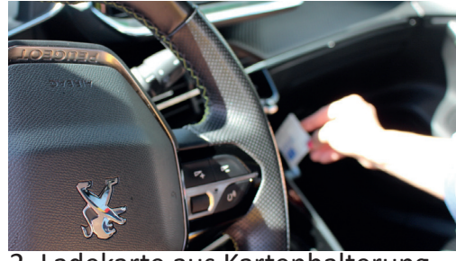
2. Ladekarte aus Kartenhalterung entnehmen