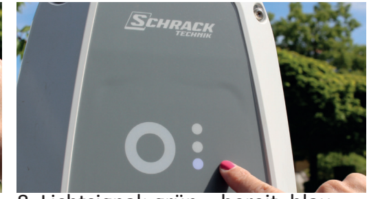
8. Lichtsignal: grün = bereit, blau = lädt, alle Lichter = Fehler